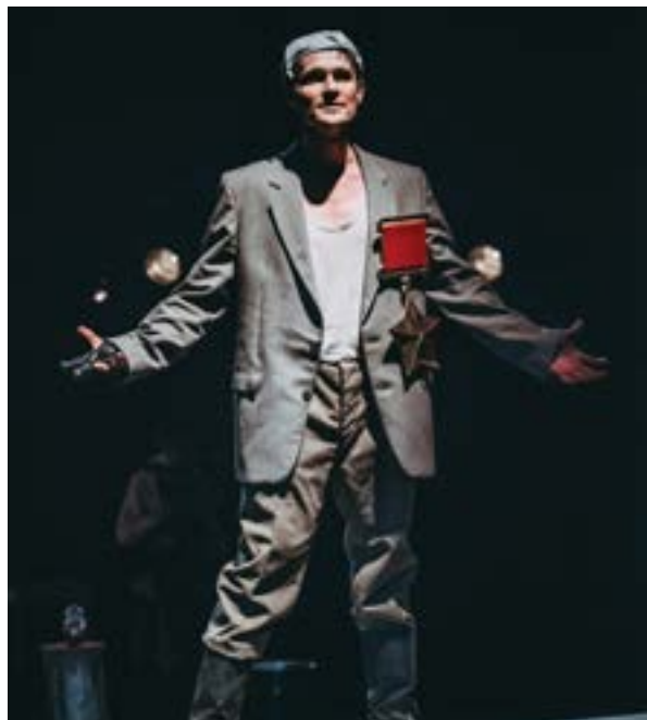
Фото спектакля Вадима Балакина