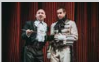
Фото спектаклей Вадима Балакина